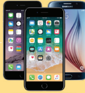
Up to 60% Off Retail Prices